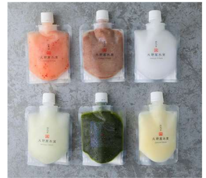
左上：【株式会社肉のふがね】素材である岩手短角牛の牧場へアドバイザー、監修シェフが訪問の様子 右上：【四代目大野屋氷室】経済産業大臣賞受賞商品 飲むかき氷