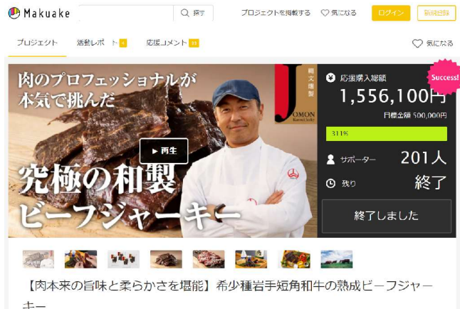
左：【株式会社甲石製館】お年賀商品「初夢もなか」の荷姿 上：【株式会社肉のふがね】マクアケのプロジェクトページ